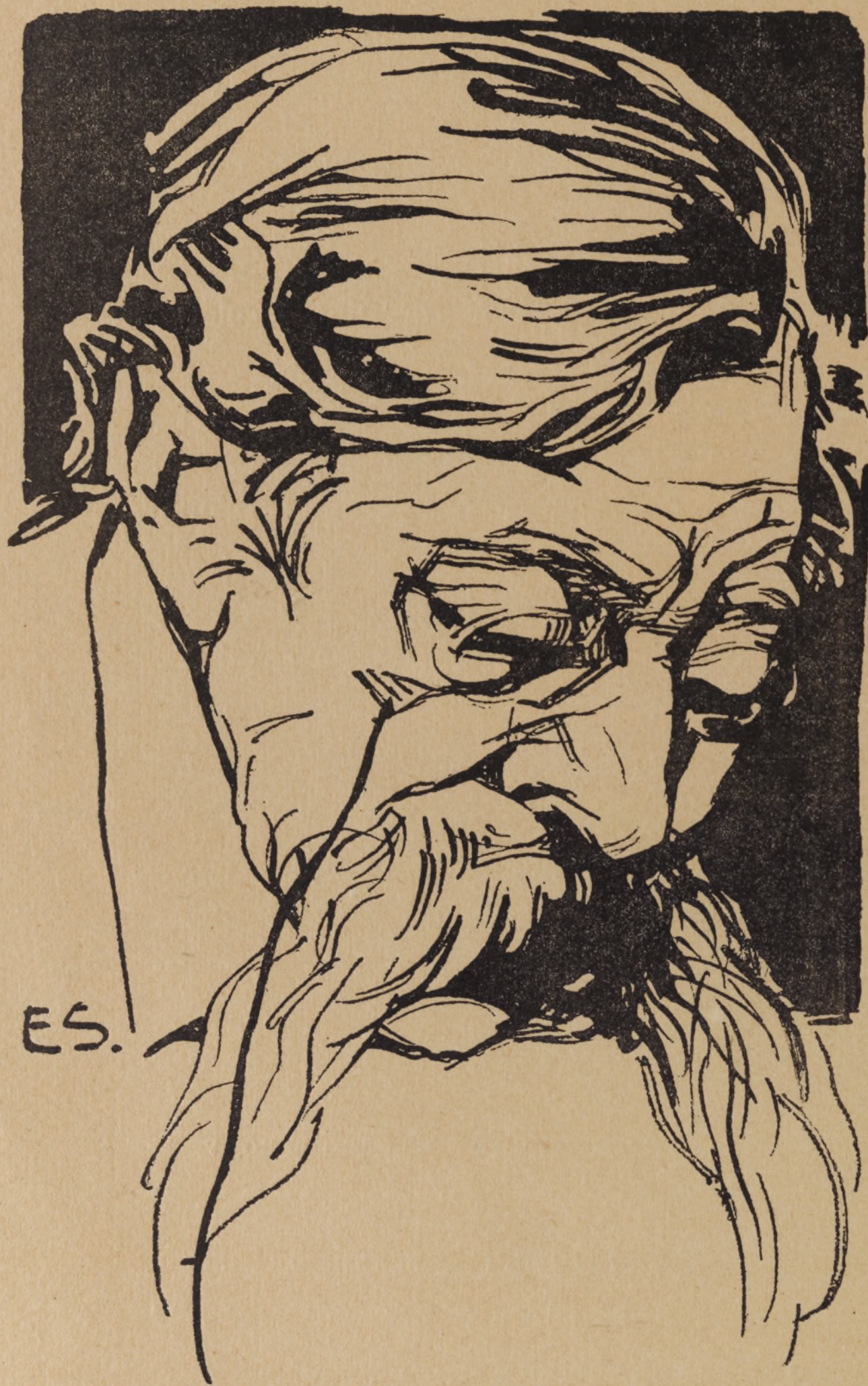
Disegno di ENRICO SACCHETTI