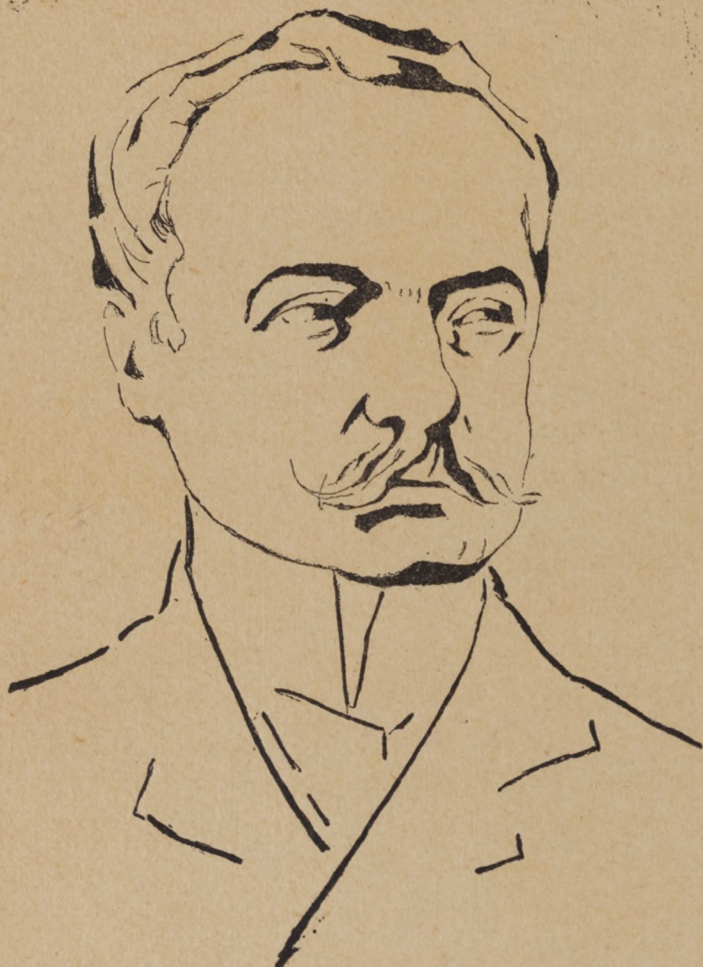
Disegno di ROMOLO ROMANI.