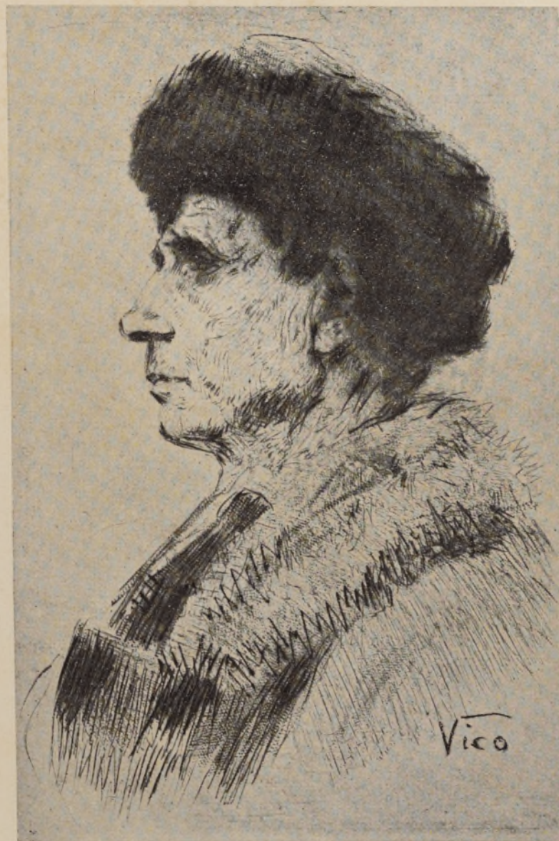
Acquaforte di VICO VIGANO'.